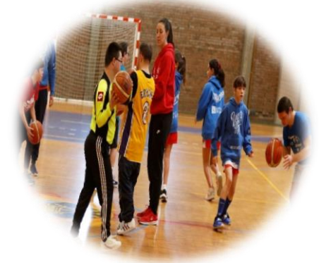
Baloncesto para personas con diversidad funcional