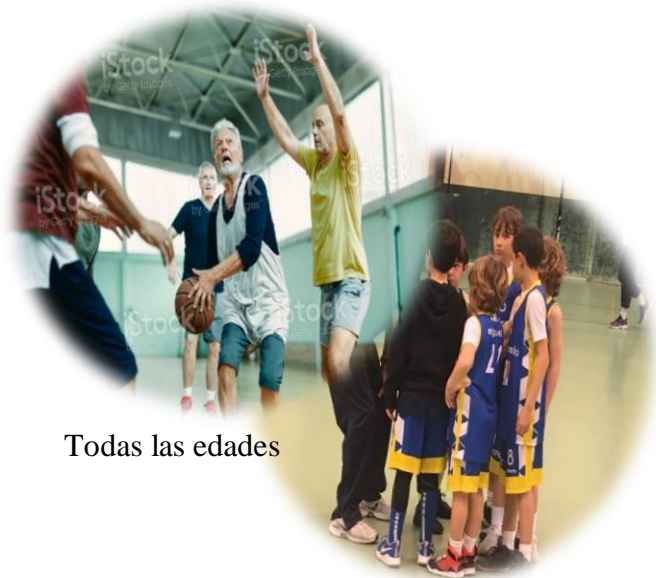
Todas las edades