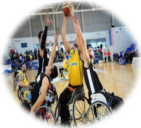
Baloncesto en Silla de Ruedas